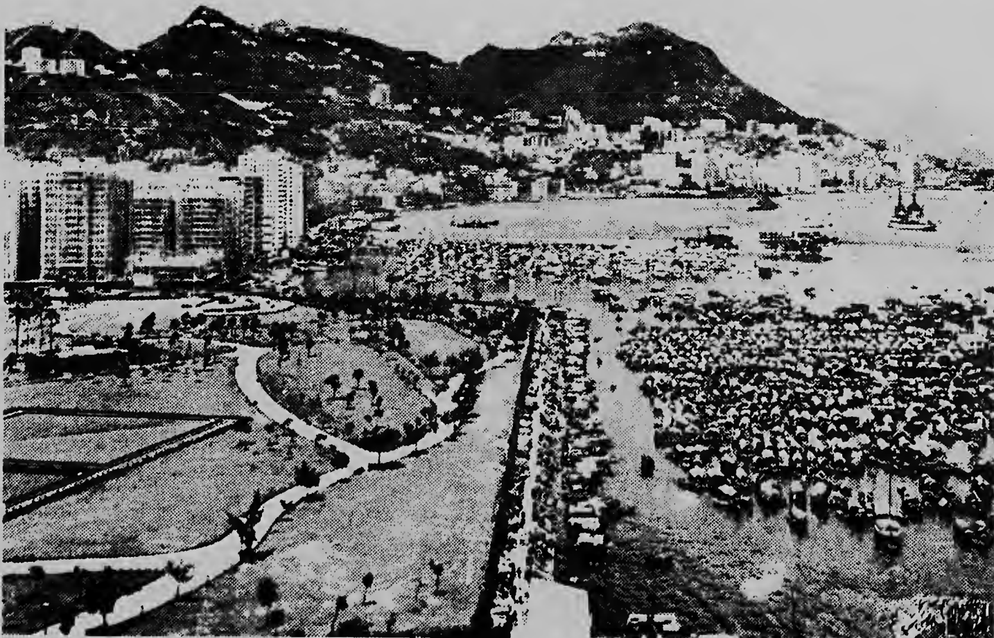
E colonia real di Gran Bretaña, Hong Kong, cu un populacion di 3.750.000 habitante ta cambiando y creciendo constantemente. E fotonan nobo aki ta muestra den foreground Victoria Park, qu ta cubri 53 acre di terra qu a ser di dempel. Den background por mira

Tambe el a hala e permiso na individualnan pa compra un suma di cincuenta dolar pa luna na placa extranjero. Solamente sumanan limita lo worde bende en lo futuro na hendenan cu ta bai exterior.